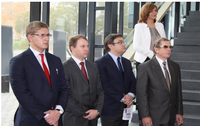
2. attēls: Rēzeknes Uzņēmēju biedrības pārstāvji un LDDK sociālā dialoga koordinatore Latgales reģionā uzņēmējsabiedrību izstādes "Rēzeknes Uzņēmējs" atklāšanā 10.10.2013.

Biedrības darbības mērķu un uzdevumu īstenošanai izveidota stabila biedrības organizatoriskā struktūra – biedrības uzraudzības institūcija ir biedrības Padome, kas sastāv no deviņiem Padomes locekļiem; biedrības pārvaldes jeb izpildinstitūcija ir biedrības valde, kas sastāv no viena valdes locekļa. Biedrības biedru darba sanāksmes tiek sasauktas ne retāk kā reizi mēnesī. Biedrības biedru sapulces notiek ne retāk kā vienu reizi pusgadā.