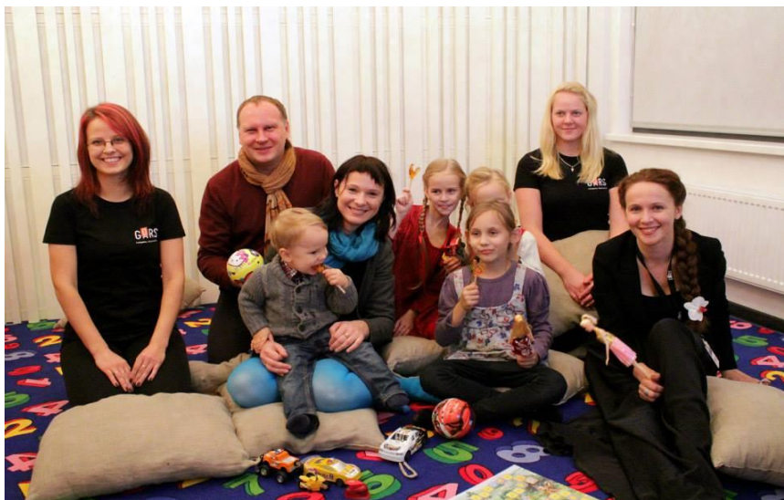
3. attēls: Īstenojot sociālās partnerības projektu, Rēzeknes Uzņēmēju biedrība atbalstīja bērnu brīvā laika pavadīšanas istabas labiekārtošanu Latgales vēstniecībā GORS (Austrumlatvijas koncertzālē). Foto no Latgales vēstniecības GORS, 2013. gada oktobris.

Biznesa atbalstam Rēzeknes Uzņēmēju biedrība sadarbībā ar LDDK Latgales reģiona darba devēju konsultatīvo centru organizē uzņēmējdarbības daudznazaru izstādi “Rēzeknes Uzņēmējs” (ik gadu rudenī) un profesionālās un augstākās izglītības iestāžu izstādi “Izglītība un Karjera” (ik gadu pavasarī).