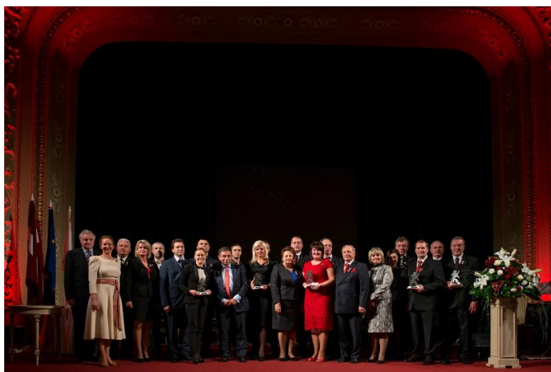
LDDK gada balvu (2014) saņēmušie uzņēmumu un organizāciju pārstāvji, kopā ar LDDK vadību un Ministru prezidenti Laimdotu Straujumu

LDDK Gada balvai izvirzītie uzņēmumi tika atlasīti sadarbībā ar "Lursoft", izvērtējot uzņēmumu apgrozījuma, peļņas un darbinieku skaita pieaugumu vairāku gadu dinamikā, kā arī, ņemot vērā Valsts ieņēmumu dienesta (VID), Valsts darba inspekcijas (VDI) un Latvijas Brīvo arodbiedrību savienības (LBAS) pieredzi sadarbībā ar konkrētajiem uzņēmumiem. Tāpat tika ņemta vērā uzņēmumu pašu sniegtā informācija par savu izaugsmi, attīstības plāniem, darba vides organizāciju un sociāli atbildīgajām aktivitātēm savā reģionā. Kopumā tika izvērtēti vairāk nekā 180 uzņēmumi visā Latvijā. Savukārt pašvaldību un valsts institūciju kategorijās balvas nominantus izvirzīja Vides aizsardzības un reģionālās attīstības ministrija (VARAM) un Valsts kanceleja.