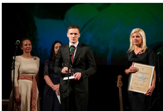
SIA GRAANUL PELLETS saņem balvu kā labākai darba devējs Vidzemes reģionā