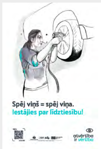
Sieviete – automehāniķe