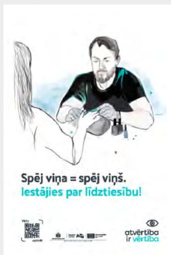
Vīrietis – manikīra meistars