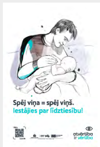
Tēvs, barojot bērnu

Šī gada "Atvērtība ir vērtība" vides plakāti ar četrus dažādu motīvu palīdzību stāsta par līdztiesību profesijas izvēlē, darba vidē un ģimenes dzīvē, aicinot iestāties par līdztiesību.