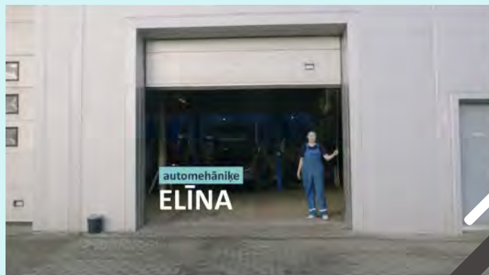
Ekrānšāviņš no sociālā eksperimenta video

https://www.youtube.com/watch?v=AYI1MiC5luI