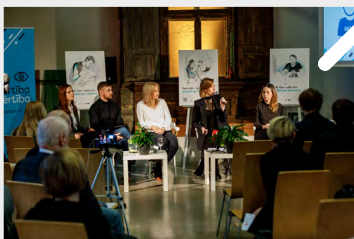
Fotogrāfijas no "Atvērtība ir vērtība" kampaņas atklāšanas un ekspertu diskusijas Rīgā, 2020. gada 11. martā