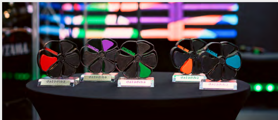
“Dažādībā ir spēks” balvas darba devējiem.

Kustības “Dažādībā ir spēks” mērķis ir veidot atpazīstamu un pozitīvu darba devēju kustību, kas par uzdevumu ikdienas darbā izvirza dažādības veicināšanu savos uzņēmumos, organizācijās, valsts vai pašvaldības iestādēs, biedrībās vai nodibinājumos - atzīstot, ka dažādība ir resurss un virzītājspēks attīstībai un izcilu rezultātu sasniegšanai ikvienā jomā, jebkādos apstākļos.