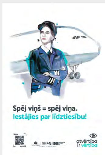
Sieviete – pilote