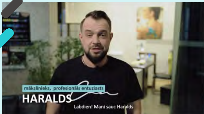
Ekrānšāviņš no sociālā eksperimenta video

Uzsākot tematisko gadu, tika veikts sociālais eksperiments, kurā noskaidrojām, kā cilvēki reaģē, ieraugot vīriešus un sievietes sev šķietami neierastās profesijās! Skaties, kāda bija skaistumkopšanas salona apmeklētāju reakciju uz manikīra meistaru un kā autoservisa klienti vērtēja automehāniķi – sievieti.